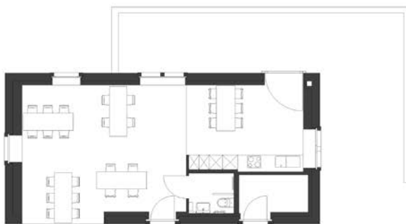
Einzeltische 26 Pers.